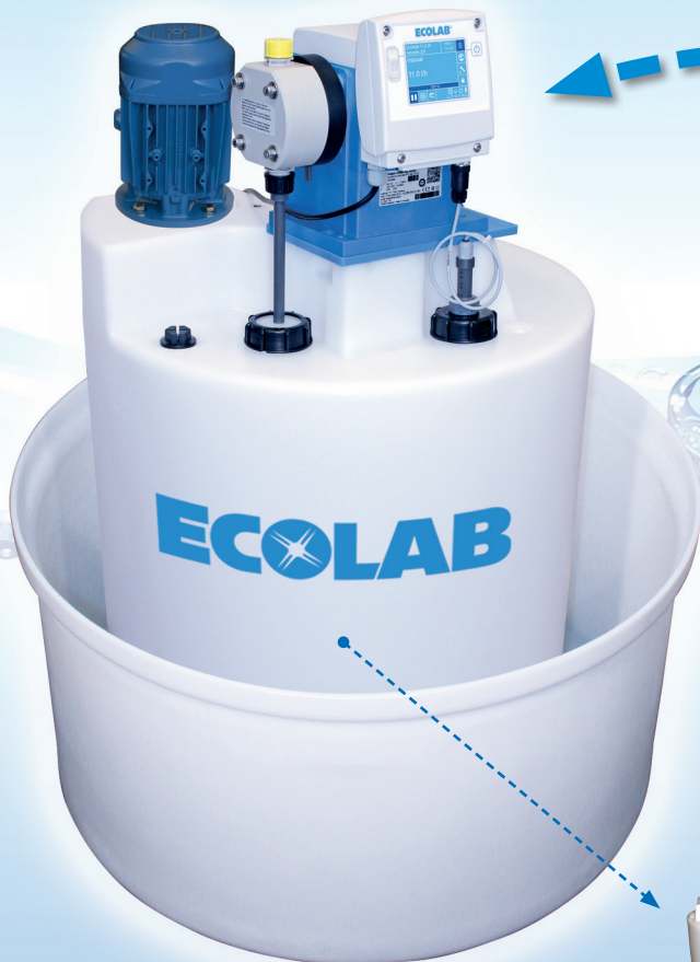
EcoPro von 5 bis 120 l/h